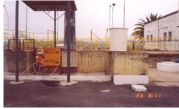
FOTOGRAFIA Nº 12. TESTE COM TORRE (690 MM X 750 MM) DE TABLETES DE ÁCIDO TRICLOROISOCIANÚRICO COM BÓIA DE NÍVEL INTERNA.