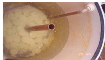
FOTOGRAFIA Nº 14. TESTE COM TORRE (300 MM X 750 MM) DE TABLETES DE ÁCIDO TRICLOROISOCIANÚRICO COM DIFUSOR INTERNO E TUBO CENTRAL INTERNO (PÓS-DESINFECÇÃO).