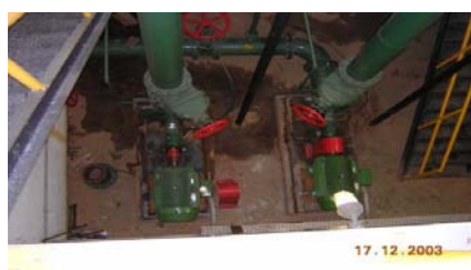
FOTOGRAFIA Nº 5. PLANTA DE TRATAMENTO DE ÁGUA DE GUARAREMA – SÃO PAULO.