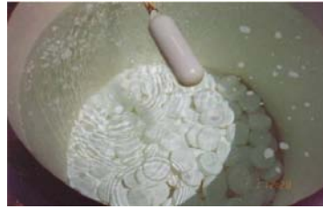
FOTOGRAFIA Nº 13. TESTE COM TORRE (690 MM X 750 MM) DE TABLETES DE ÁCIDO TRICLOROISOCIANÚRICO COM DIFUSOR INTERNO E TUBO CENTRAL INTERNO.