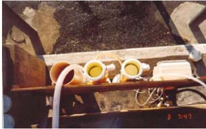
FOTOGRAFIA Nº 10. TESTE COM UMA TORRE (150 MM X 750 MM) DE TABLETES DE ÁCIDO TRICLOROISOCIANÚRICO.